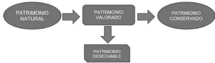
Diagrama: 1 Proceso de Conservación del Patrimonio Natural

las condiciones y determinan los indicadores de lo que puede ser o no considerado como elemento de conservación patrimonial.