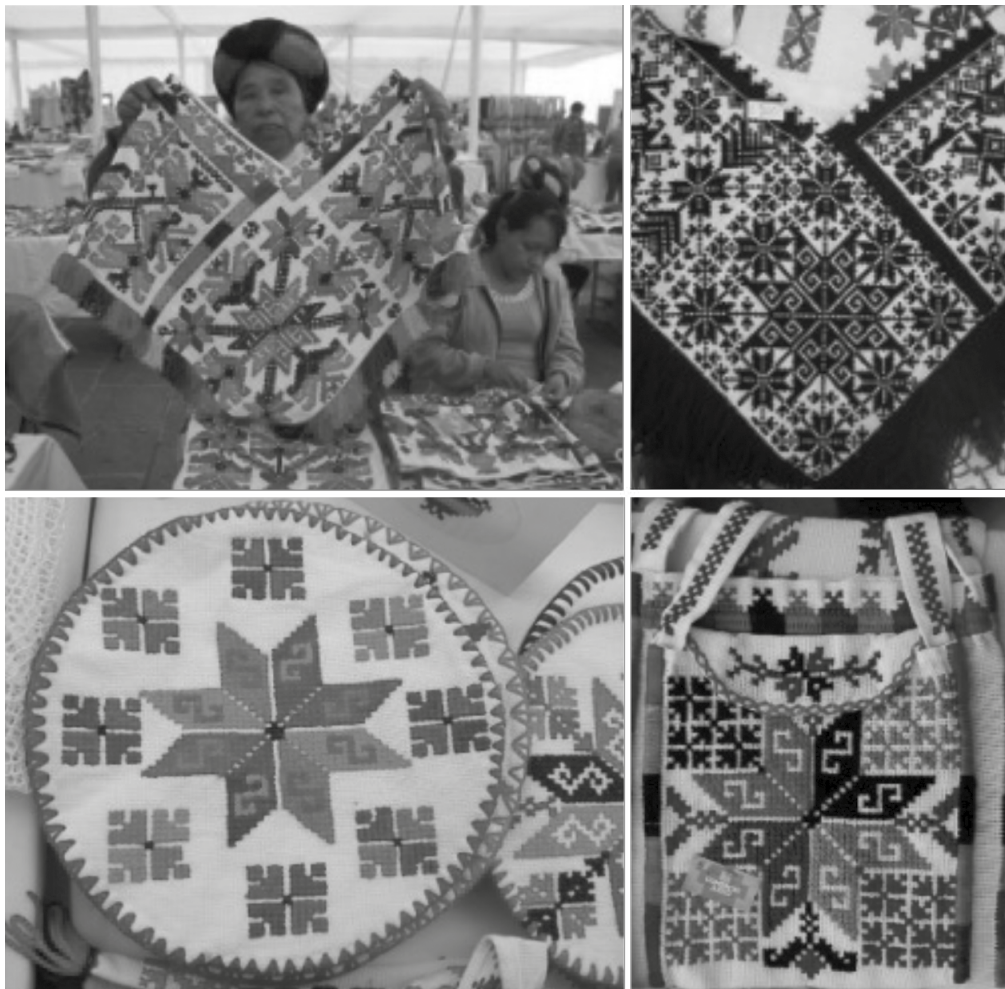
Figura 4. Feria artesanal en San Luis Potosí capital 2015. Nota. Fotografía: Soria, C. (2015).

Por otro lado, la habilidad y creatividad que han desarrollado las mujeres en el bordado les permite crear un medio de trabajo complementario para generar recursos económicos que promuevan el sustento de sus familias, esta actividad también contribuye en el desarrollo personal que les permite distribuir su tiempo en actividades remuneradas y no remuneradas como el trabajo doméstico y de cuidados. También, algunas familias regularmente tienen un espacio