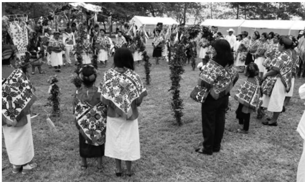
Figura 2. Ritual del maíz en centro arqueológico de Tamtoc. Nota. Fotografía por Soria, C., 2015.

conforme a las necesidades y gustos de las nuevas generaciones, pero se mantiene de cierta forma la identidad de la cultura de origen, siendo una manera de continuar con la apropiación del bordado y perdurar el uso de los mismos.