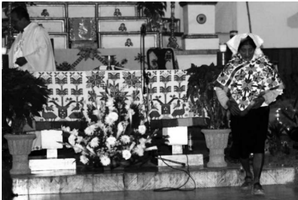
Figura 3. Iglesia de Aquismón. Nota.

Ahora bien, un aspecto interesante de la cultura teenek es la asociación que se establece entre la mujer y la madre tierra por la cualidad de fertilidad, este pensamiento se puede reflejar en el dhayemlaab tanto por el uso de sus formas de rombo, donde la mujer al colocarse la prenda queda rodeada de elementos bordados que representan la naturaleza y la cultura. Por tanto, el dhayemlaab podría relacionarse como una especie de ofrenda para agradecer y realizar