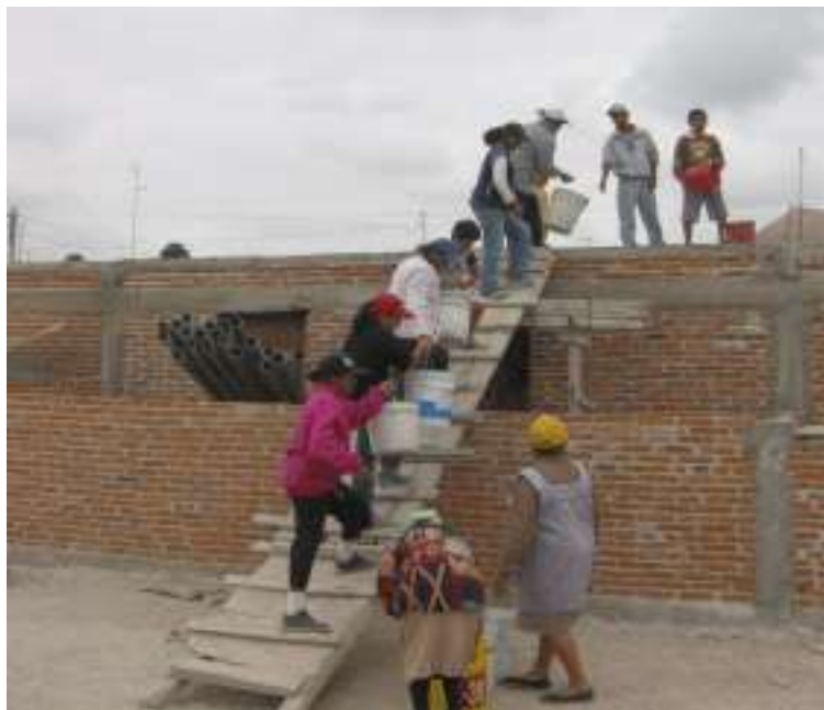
Imagen 2: Mujeres organizadas en cadena para subir materiales para colado de losa. Col. Los Limonos. San Luis Potosí, México. Junio 2009.

gún el orden de afiliación cronológica de las mujeres participantes al programa o, en su caso, a consideración del comité directivo y la asamblea general, a aquellas familias con mayor necesidad de ocupar la vivienda. Una vez entregada en obra negra, la familia con recursos propios la termina colocando herrería, pisos, instalaciones, acabados exteriores e interiores, etc.